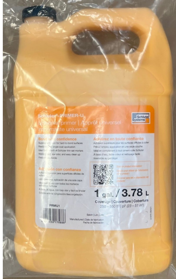
PHOTO DE L'ÉCHANTILLON

Voici une image de l'échantillon soumis aux tests.