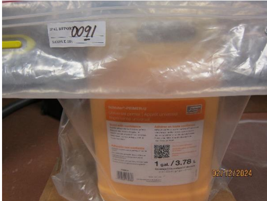
Photo of Sample Received Feb. 12, 2024: 24-006-03 (IPAL-0091-24) Primer

ISO 17025 Compliant PA Registration #68-1664 DEA Registered