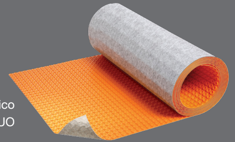
Membrana de desacoplamiento con control de acústico integrado y barrera térmica Schluter®-DITRA-HEAT-DUO