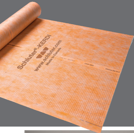
Membrana de impermeabilización y retardante de vapor Schluter®-KERDI