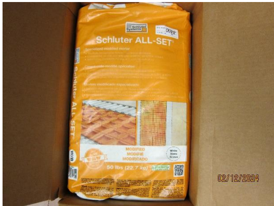
Photo of Sample Received Feb. 12, 2024: 24-006-01 (IPAL-0088-24) Mortar

ISO 17025 Compliant PA Registration #68-1664 DEA Registered