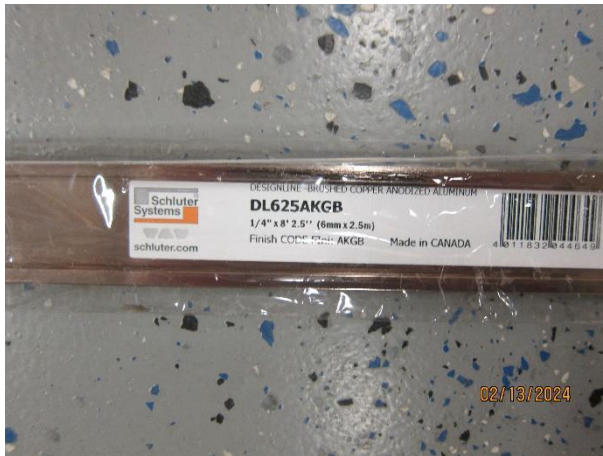
Photo of Sample Received Feb. 13, 2024: 24-006-06 (IPAL-0090-24) Metal Accessory

ISO 17025 Compliant PA Registration #68-1664 DEA Registered