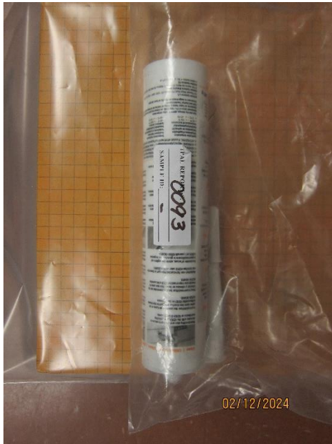
Photo of Sample Received Feb. 12, 2024: 24-006-05 (IPAL-0093-24) Kerdi-Fix

ISO 17025 Compliant PA Registration #68-1664 DEA Registered