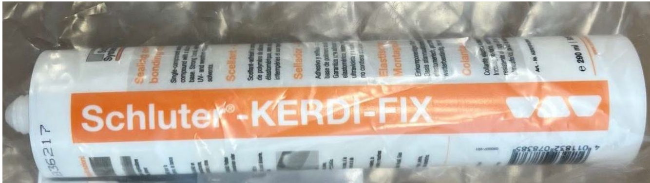
PHOTO DE L'ÉCHANTILLON

Voici une image de l'échantillon soumis aux tests.